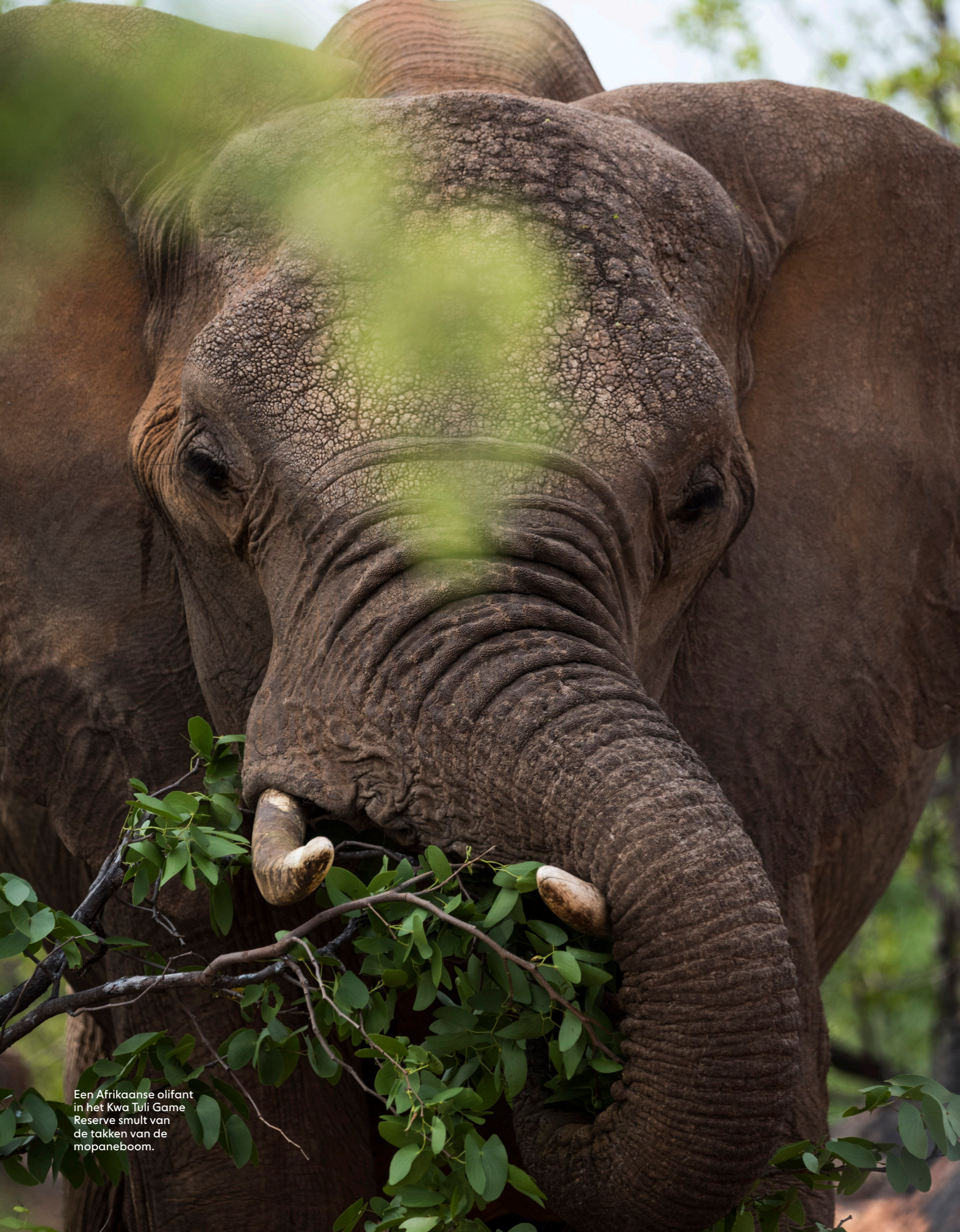
Een Afrikaanse olifant in het Kwa Tuli Game Reserve smùlt van de takken van de mopaneboom.