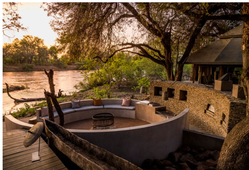
De boma (een plek voor vuur, verhalen en diners) van Koro River Camp. Op de achtergrond de Limpoporivier.

Het nieuwe Harena ('ons land') Trails Camp is een kamp bestaande uit een ruime lounge tent en kleine slaaptenten, en voor wie durft: veldbedden in de buitenlucht. Dit kamp, dat snel op- en afgebouwd en verplaatst kan worden, is de uitvalsbasis voor wandel- en mountainbikesafari's in het vijfduizend hectare tellende gebied rond het dorp Mathathane, dat eigendom is van de lokale gemeenschap. In deze wildernis leven onder meer leeuwen, luipaarden, cheeta's, olifanten en bruine hyena's. the-africa-experience.com