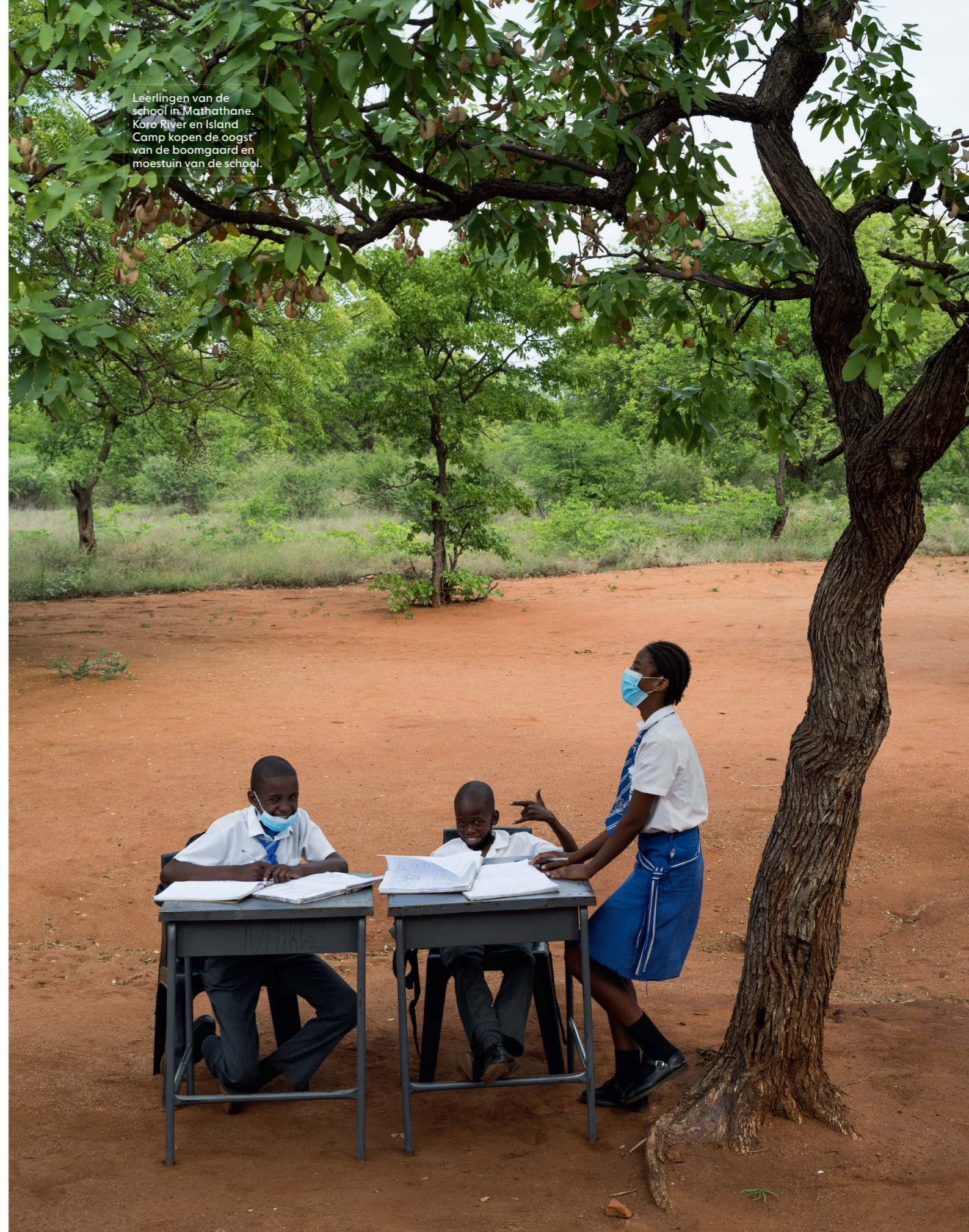
Leerlingen van de school in Mathathane. Koro River en Island Camp kopen de oogst van de boomgaard en moestuin van de school.