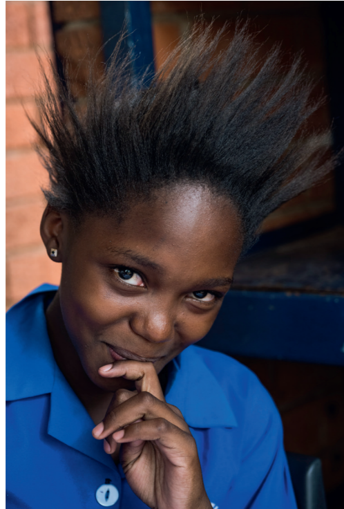
Een schoolmeisje in het dorp Mathathane.

Stipt om 4.30 uur, wanneer de lucht achter de rivier blauw, paars, roze en oranje kleurt, zien we over de boardwalk een licht naderbij komen.